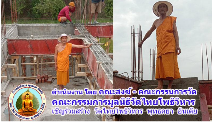
ดำเนินงาน โดย คณะสงฆ์ - คณะกรรมการวัด คณะกรรมการมูลนิธิวัดไทยโพธิวิหาร เชิญร่วมสร้าง วัดไทยโพธิวิหาร พุทธคยา อินเดีย