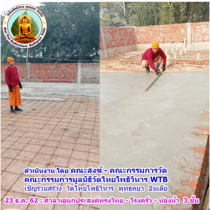
ดำเนินงาน โดย คณะสงฆ์ - คณะกรรมการวัด คณะกรรมการมูลนิธิวัดไทยโพธิวิหาร WTB เชิญร่วมสร้าง วัดไทยโพธิวิหาร พุทธคยา อินเดีย 23 ธ.ค. 62 : ศาลาเอนกประสงค์ทรงไทย - โรงครัว - ห้องน้ำ 3 ชั้น