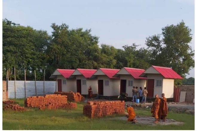
จำเป็นเร่งด่วน : วัดไทยโพธิหาร สร้างใหม่ไม่มีศาลาทำกิจของสงฆ์ สวดมนต์กลางแจ้ง ถ้ำฝนตกมาต้องหนีเข้าร่วม