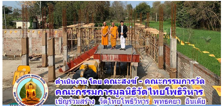
ดำเนินงาน โดย คณะสงฆ์ - คณะกรรมการวัด คณะกรรมการมูลนิธิวัดไทยโพธิวิหาร เชิญร่วมสร้าง วัดไทยโพธิวิหาร พุทธคยา อินเดีย