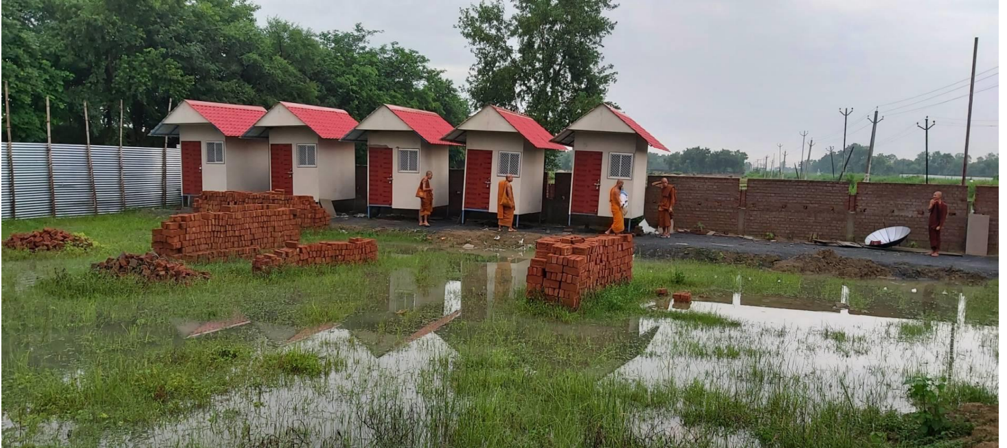
ศาลาเฉลิมพระเกียรติ "พุทธบูชาธรรมหรรษาสამัคคี"