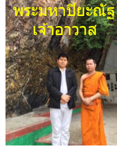
พระมหาปิยะฉัตร เจ้าอาวาส