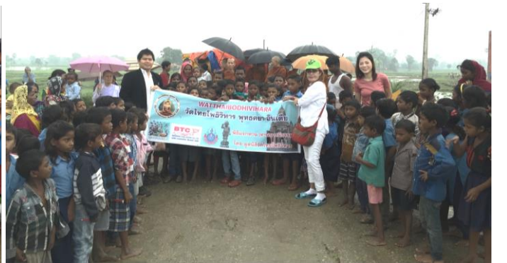
1 ส.ค. 2561 บ่าย : แจกทานให้คนมีรายได้น้อย ผู้กมิตรสัมพันธ์กับคนในพื้นที่ ณ บ้านสัการะ