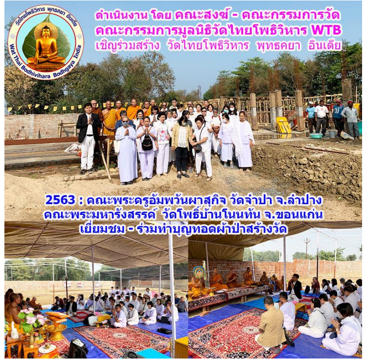
2563 : คณะพระครูอัมพวันผาสกิจ วัดจำปา จ.ลำปาง คณะพระมหารังสรรค์ วัดโพธิ์บ้านโนนทัน จ.ขอนแก่น เยี่ยมชม - ร่วมทำบุญทอดผ้าป่าสร้างวัด