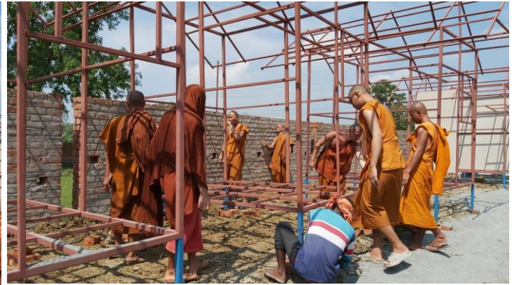
ก.ค. 2562/2019 : โครงการก่อสร้างกุฏิสงฆ์กรรมฐาน จำนวน 5 หลัง สถานที่จำพรรษา