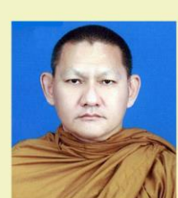
พระอ.พิสิษฐ์ จรณธมโม Phra Pisith Jaranadhammo หัวหน้ากองงานศึกษาปฏิบัติธรรมและสังคมสงเคราะห์