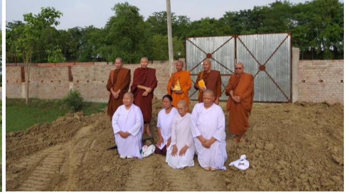
พฤษภาคม 2562/2019 : โครงการก่อสร้างกุฏิสงฆ์กรรมฐาน-ชุดเจาะบ่อบาดาล-แทงน้ำ