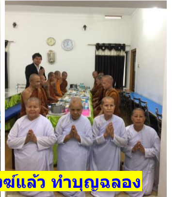
1 ส.ค. 2561 เช้า : หลังจากได้ทำสัญญาซื้อที่ดิน-นำสัญญาถวายพระสงฆ์แล้ว ทำบุญฉลอง