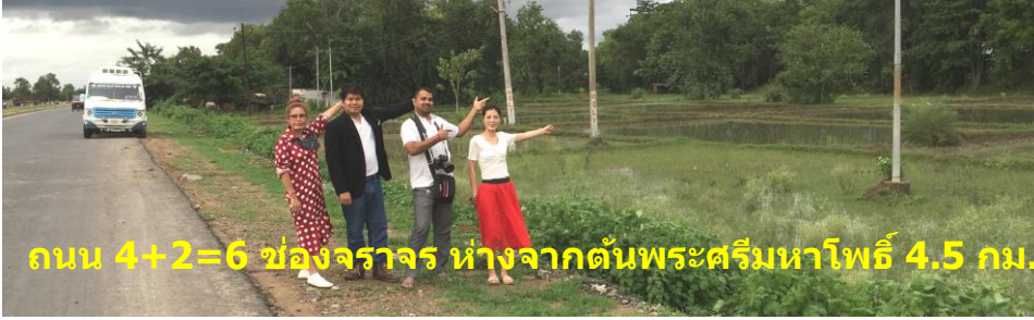
ถนน 4+2=6 ช่องจราจร ห่างจากต้นพระศรีมหาโพธิ์ 4.5 กม.