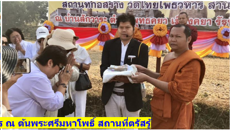
18 พ.ย. 2561 : พิธีทอดกฐินวัดไทยโพธิวิหาร ณ ต้นพระศรีมหาโพธิ์ สถานที่ตรัสรู้