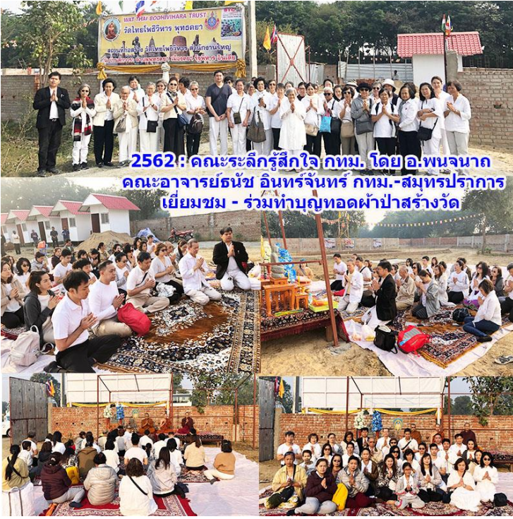
2562 : คณะระสิกรู้สึกใจ กทม. โดย อ.พนจนาถ คณะอาจารย์ณัช อินทร์จันทร์ กทม.-สมุทรปราการ เยี่ยมชม - ร่วมทำบุญทอดผ้าป่าสร้างวัด